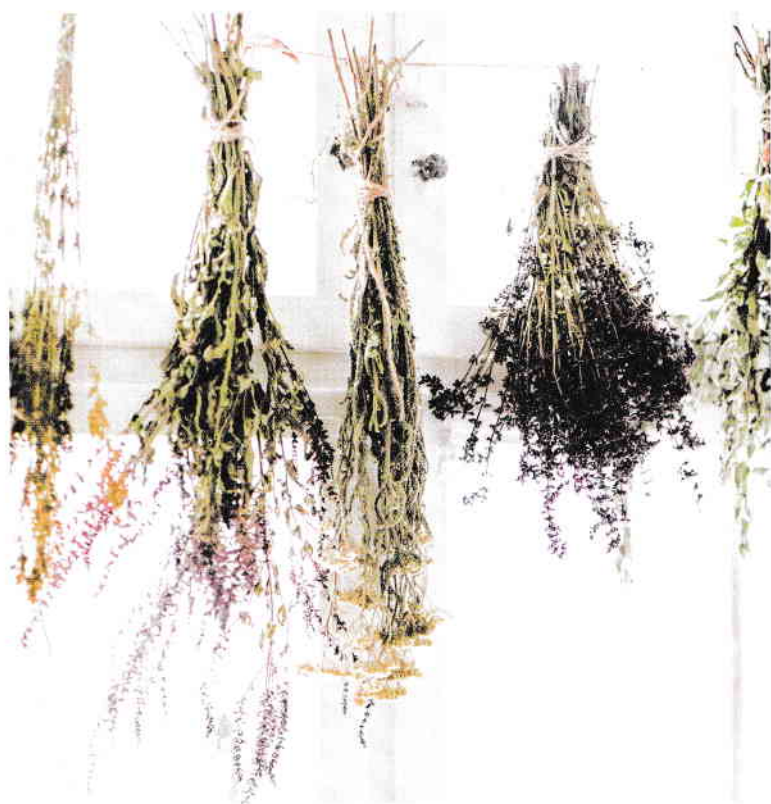
Detaliu cu plante medicinale la uscat în atelier, 2019

omului cu locul și poate ajuta în articularea narativă a conexiunilor istorice dintre trecut și prezent, în încercarea de definire identitară a unui loc istoric. 1 Eu am fost antrenată să observ și să transpun observația în imagine. Am observat vieți și visuri pe care le-am transpus în proiecte de arhitectură, așa cum mai târziu am observat istorii botanice pe care le-am transpus în artă. Și totuși, mirosul rămâne o peliculă a istoriei pe care nu reușesc să o transpun în nimic mai mult decât în narațiune, cuvinte înșirate care sper să declanșeze în efect de domino noi și noi legături și amintiri. Așadar, încep povestea și călătoria printre florile Transilvaniei.